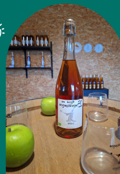
◆ Tourisme St-Meen Montauban