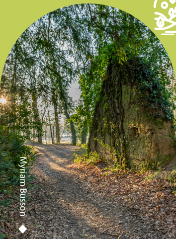
◆ Myriam Bussotti

Dans la campagne de Muel profitez d'une petite balade ombragée d'une quinzaine de minutes. Les Buttes de la Hautière, c'est l'endroit idéal pour un pique-nique en famille ou entre amis. Vous y découvrirez une rivière avant d'accéder à un petit bois. Cet espace naturel sensible est très apprécié des pratiquants de VTT pour ses fameuses buttes.