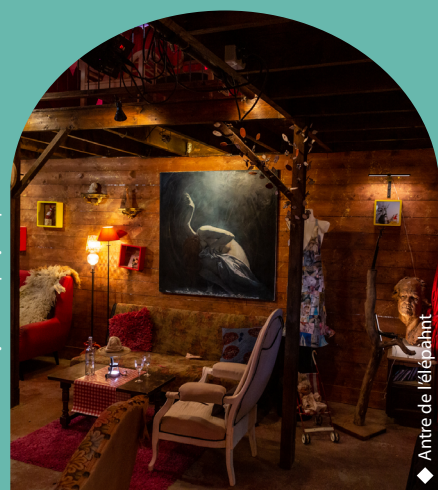
◆ Antre de l'éléphant