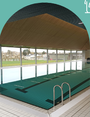
◆ Espace aqualudique Acorus

L'espace labellisé Accueil Vélo vous propose différentes activités pour vous détendre, vous amuser et de nager ! Vous y trouverez un bassin sportif avec 4 couloirs, une pataugeoire avec ses jeux et d'un bassin ludique avec des jets, une plaque à bulle et une cascade pour se détendre. L'espace labellisé Accueil Vélo, propose différentes activités.