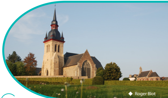
◆ Roger Blot