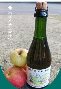
◆ Cidrerie Huby