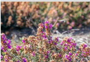
Flore_Réserve Naturelle Monteneuf

Monteneuf le 15/04/2026 Le 22/04/2026 Menhirs et Landes de Monteneuf Tarif : Payant / 0 €