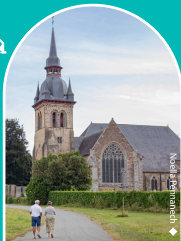
◆ Noëlla Pennanech

L'abbatiale de Saint-Méen, classée Monument Historique depuis 1990, est l'une des plus anciennes abbayes d'Ille et Vilaine. Des visites guidées sur réservation et un livret de visite libre vous sont proposés par l'Office de Tourisme.