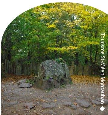
Tourisme St-Méen Montauban

Découvrez le Tombeau de Merlin, formé de trois pierres de schiste rouge. Offrez-vous un moment hors du temps en forêt pour découvrir ce lieu mythique. Parmi les légendes de Brocéliande, la fée Viviane y aurait empoisonné l'enchanteur Merlin.