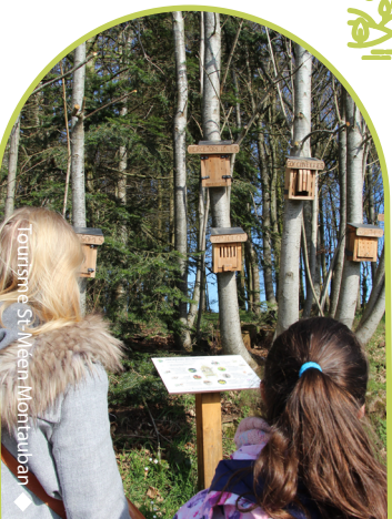
Tourisme St-Méen Montauban

Informez vous sur la faune et la flore à Saint Pern. Lors d'une balade découvrez des abris dédiés aux animaux, une ruche pédagogique et plusieurs énigmes tout au long du parcours.