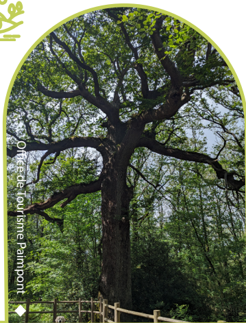
◆ Office de Tourisme Paimpont

Découvrez le chêne des hindrés, répertorié arbre remarquable depuis 1997. Âgé d'environ 500 ans, il est l'un de ses plus vieux représentants de son espèce dans la forêt de Paimpont. Pour prolonger la promenade, une boucle de 4 km est possible.