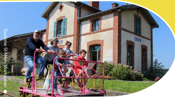
Tourisme St-Méen Montauban

Découvrez la gare de Médréac ! Amusez-vous et découvrez ! Empruntez l'ancienne voie ferrée, à bord de vélo-rail. Immergez dans son histoire, avec le musée ferroviaire. Pour une pause hors du temps, le café sur place vous propose des boissons et des biscuits locaux.