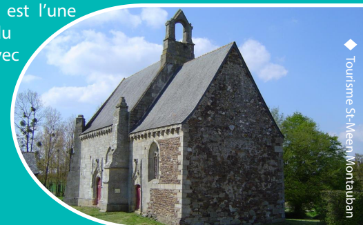
Tourisme St-Méen Montauban

Découvrez la chapelle de Lanelou située dans la campagne montalbanaise, tout près des rails du vélo-rail de Médréac. Elle est classée aux monuments historiques depuis 1942 et est l'une des plus belles du département, avec son campanile.