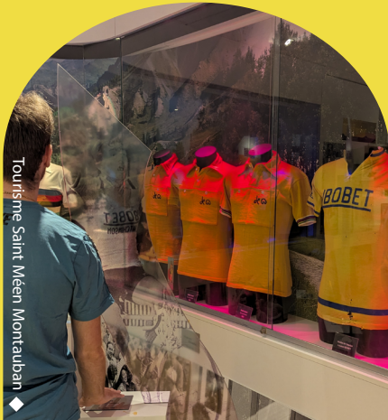
◆ Tourisme Saint-Méen Montauban