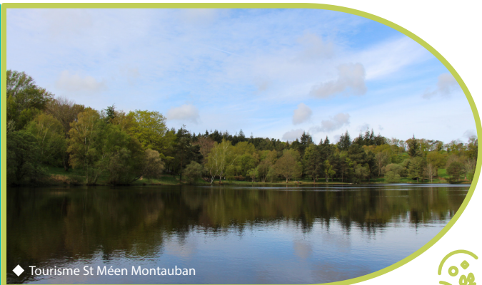
◆ Tourisme St Méen Montauban