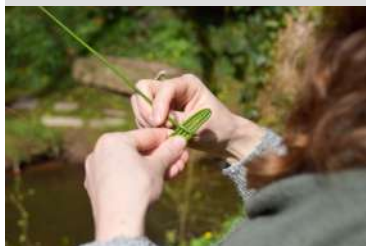
les Jardins de Brocéliande

02 99 60 08 04 accueil.jdb@lepommeret.fr