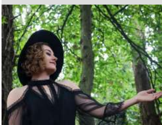
© Alice Deshays - Les Saltimbanques

02 97 70 52 60 cielessaltimbanques@outlook.fr