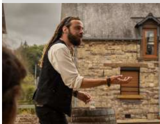
© Alice Deshays - Cie Les Saltimbranques

02 97 70 52 60 cielessaltimbranques@outlook.fr