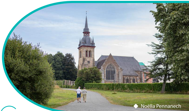
◆ Noëlla Pennanech