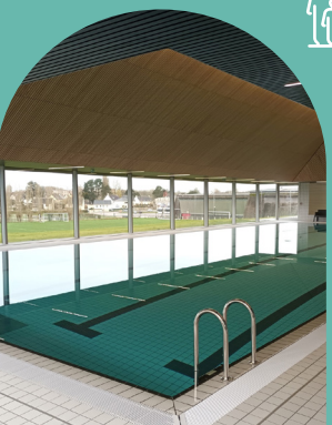
◆ Espace aqualudique Acorus

L'espace labellisé Accueil Vélo vous propose différentes activités pour vous détendre, vous amuser et de nager ! Vous y trouverez un bassin sportif avec 4 couloirs, une pataugeoire avec ses jeux et d'un bassin ludique avec des jets, une plaque à bulle et une cascade pour se détendre. L'espace labellisé Accueil Vélo, propose différentes activités.