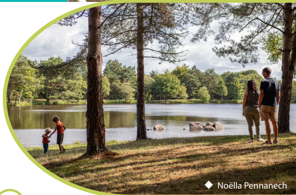
◆ Noëlla Pennanech