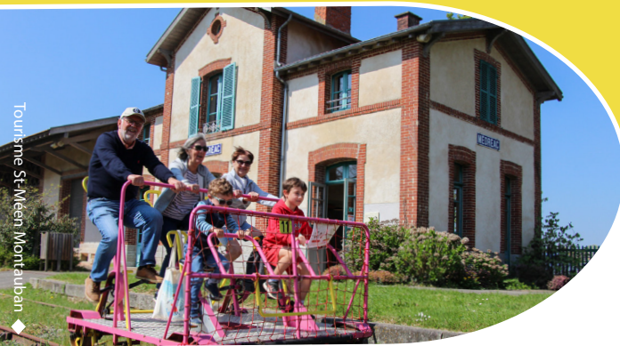
Tourisme St-Méen Montauban

Découvrez la gare de Médréac ! Amusez-vous et découvrez ! Empruntez l'ancienne voie ferrée, à bord de vélo-rail. Immergez dans son histoire, avec le musée ferroviaire. Pour une pause hors du temps, le café sur place vous propose des boissons et des biscuits locaux.