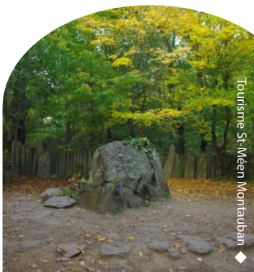
Tourisme St-Méen Montauban

Découvrez le Tombeau de Merlin, formé de trois pierres de schiste rouge. Offrez-vous un moment hors du temps en forêt pour découvrir ce lieu mythique. Parmi les légendes de Brocéliande, la fée Viviane y aurait empoisonné l'enchanteur Merlin.