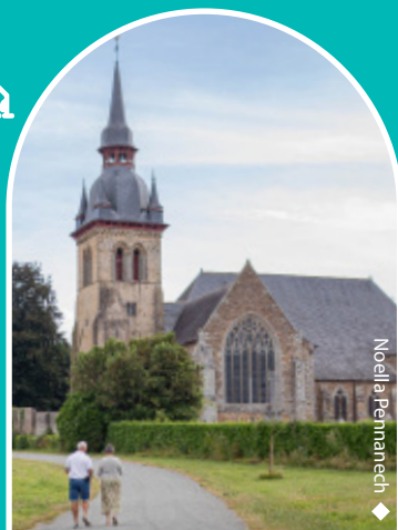
◆ Noella Pennanech

L'abbatiale de Saint-Méen, classée Monument Historique depuis 1990, est l'une des plus anciennes abbayes d'Ille et Vilaine. Des visites guidées sur réservation et un livret de visite libre vous sont proposés par l'Office de Tourisme.