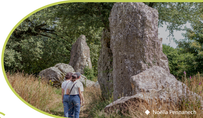
◆ Noëlla Pennanech